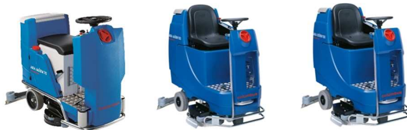
Abbildung mit optionaler Ausstattung