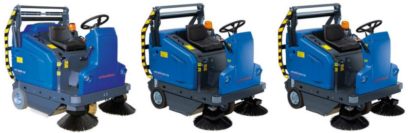
Abbildung mit optionaler Ausstattung

AKS 80|BM 108 AKS 80|VM 108 AKS 80|VDM 108