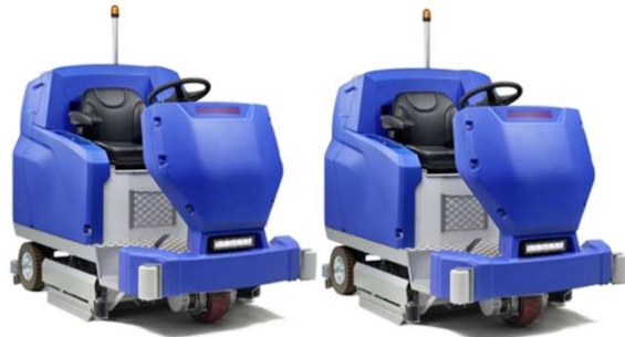
Abbildung mit optionaler Ausstattung