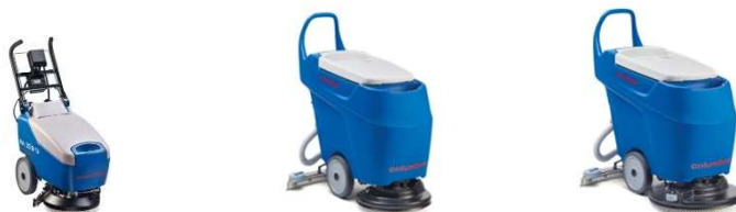
Abbildung mit optionaler Ausstattung