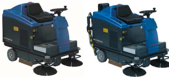
Abbildung mit optionaler Ausstattung