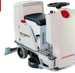
Abbildung mit optionaler Ausstattung