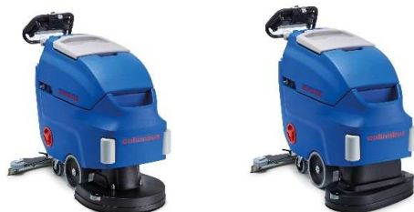
Abbildung mit optionaler Ausstattung