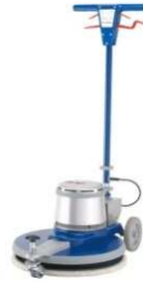
Abbildung mit optionaler Ausstattung