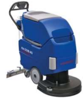
Abbildung mit optionaler Ausstattung