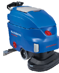
Abbildung mit optionaler Ausstattung