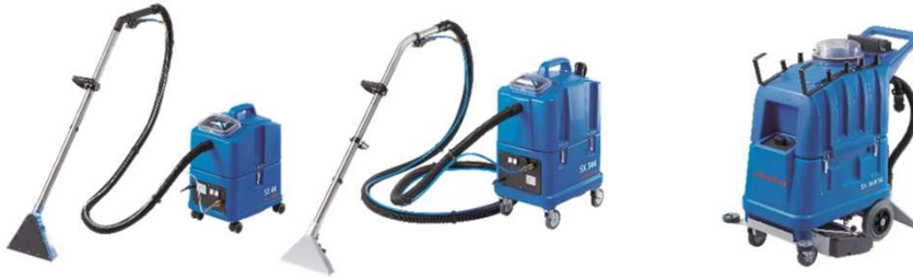
Abbildung mit optionaler Ausstattung